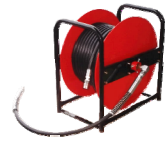
ホースドラム (セット30Dのみ)