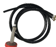
ツイン吸余水ホース+ おもしフィルター+ 吸水フィルター