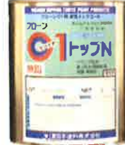
フローン01 トップN グレー 3kg