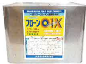
フローン01 Xグレー 10kg