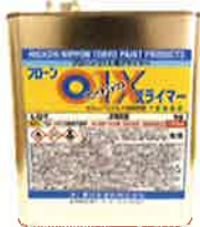
フローン01 Xプライマー 2kg