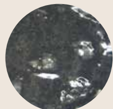
エスケー強化シーラー